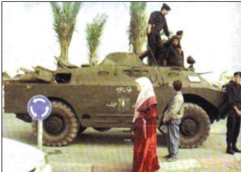
BRDM2 הנושא את סמל הרשות הפלשתינית: צה"ל ממשיך להכחיש את קיומם של משוריינים אלה ברמאללה

ניתוח פעילותם המבצעית של מספר כלי-הרכב המשוריינים מצביע על היכולת לבצע מכה לילית ראשונה נגד 40 יישובים קטנים ומבודדים בעת ובעונה אחת.