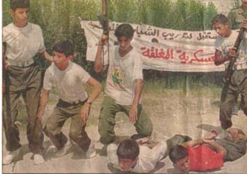
מחנה אימונים של נוער הפתח. הכנות לקראת כיבוש היישובים.

ממשלת ברק אימצה את תשע הנקודות של נתניהו, אולם בחרה להדגיש אחת מהן, והיא: העמדת היישובים מול יישובים אחרים במדיניות "הפרד ומשול", שבמהרה תגיע לשיסוי היישובים זה בזה. בכך שיכריז על יישובים אחדים כ"בטוחים", תוך נטישת יישובים אחרים, אפשר יהיה לחוץ על היישובים "הבטוחים" להפנות עורף ליישובים הננטשים. גישה זו באה לעולם על מנת למנוע מצב ממנו חוששת הממשלה: אחדות המאבק למען עתיד ישי"ע.