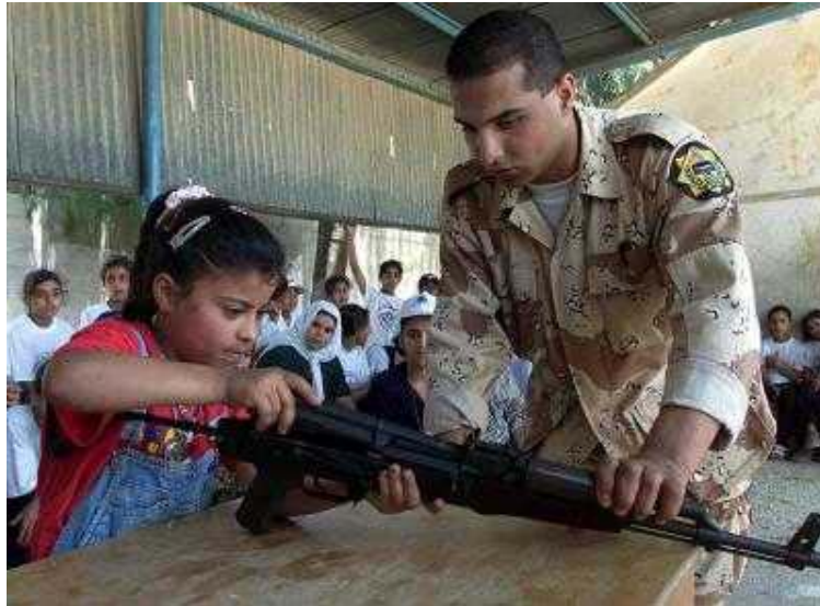
ילדות בנות 8 מתאמנות בפירוק והרכבה של קלשניקוב.

האינדוקטרינציה של הילדים ברשות הפלשתינית זהה כללית לזו של ה"היטלר יוגנד". מילות ההמנון של "אשבל", תנועת הנוער של הפתח, כוללות את המשפט "הזהרו לכם הו, ציונים, שתיית דם יהודי הוא מנהגנו". קרי: וריאציה על מלות ההורסט ווסל, ההימנון הנאצי: כאשר דם היהודים יותז מן הסכין..."