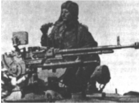
12.7mm D.Sh.K. or Gurianov (PA)

עוצמת החדירה של מקלע ה-12.7 מ"מ הנה פי שלושה בערך מעוצמת החדירה של מקלע ה-7.62 מ"מ, כשמשוויים ביניהן עפ"י המשוואה [עוצמה = מסה כפול ריבוע המהירות].