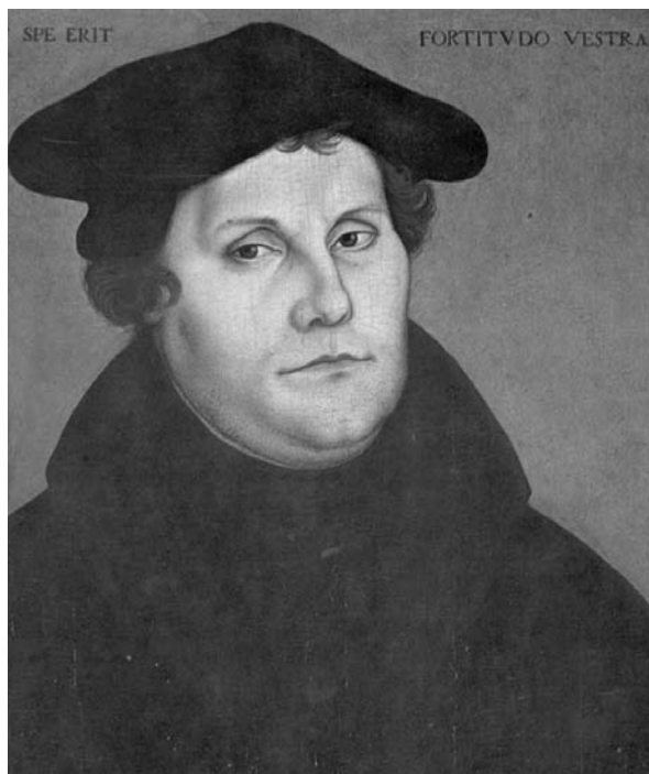
מרטין לותר. לוקס כרנאך, 1529.

לותר מצא את מותו ב-1546, אולם השנאה האנטישמית לא באה אל קיצה. אדרבא, היא המשיכה להתקיים והעלתה מורסות והתגשמה בעידן המודרני בצורה ששימשה כנראה מבשרת האידיאולוגיה הנאצית. טענה זו, נסתרה בידי רבים הסבורים, שלרטוריקה של לותר הייתה השפעה זעומה אם בכלל על השקפות הנאצים. אולם השלכות השפעתו של לותר מקבלות חיזוק כאשר זוכרים, שיולוס שטרייכר, אדריכל מכונת התעמולה הנאצית, קיבל ב-1937 במתנה את ספרו של לותר, "על היהודים ועל שקריהם", מידי העיר נירנברג – אותה עיר שמאוחר יותר הוא יישפט בה, יורשע ויוצא להורג על חלקו בהשמדת מיליוני יהודים.