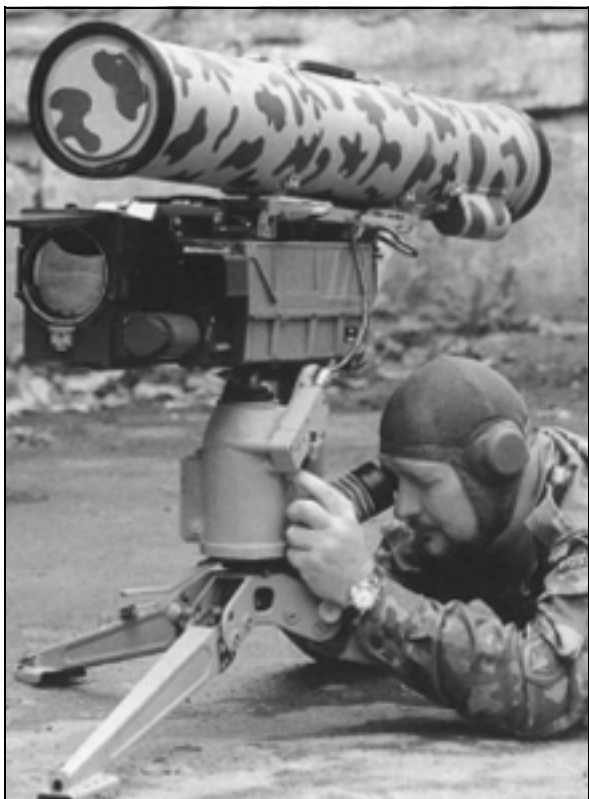
קורנט (AT14), טיל מתקדם נגד טנקים מתוצרת רוסיה.

בחזית? אם כך אמנם קרה, מדובר באחד מגדולי המחדלים הביטחוניים של מערכת הביטחון ובחוסר-מקצועיות אסטרטגית משוועת). 14 לחילופין, ניתן להשתמש בדרום-לבנון כציר אפשרי ובטוח יחסית לתנועת כוחות אויב במהלך איגוף או כיתור לכוח הצה"לי הנלחם בגבול הסורי. בכלל דרום-לבנון יכולה לשמש כציר הבקעה מוצלח, שכן התנועה עד לקו הגבול בטוחה ומוסתרת יחסית. כן גם יכולה דרום-לבנון לשמש כציר נסיגה מצוין בשעת הצורך ועוד.