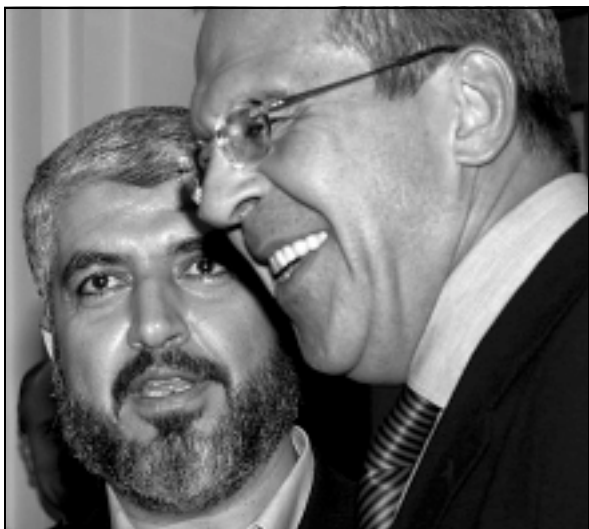
שר החוץ הרוסי, סרגיי לברוב, נפגש עם ראש החמאס, חאלד משעל, מוסקבה, מרץ, 2006.

כאיים קיומי מבחינת ישראל – ואף מתקיים יחס אימנטי בין גודל ניצחונו להיקף השמדתו. אלא שמרגע בו רכש האויב יכולת גרעינית, משתנים כללי המשחק: אופי ההרתעה במצב של בלעדיות גרעינית שונה לגמרי ממצב של הדדיות גרעינית, עובדה שכנראה איננה ברורה די הצורך למנהיגינו. במצב חדש זה, ישנה היתכנות גבוהה שהפעלת אטום תוביל להשמדה הדדית, ומשמעות העניין היא שבמקום שישראל תתלבט בדילמה שקרנה האחת הפסד במלחמה קרקעית וקרנה השנייה ניצחון המושג בדרך גרעינית, היא תתלבט בדילמה אחרת לחלוטין: להפסיד במלחמה קרקעית, או להיות מושמדת ע"י הנשק הגרעיני של האויב (לאחר שהפעילה את הגרעין שלה). זוהי משוואה חדשה, אשר הופכת את השימוש בנשק גרעיני להתאבדות לאומית; לא עוד הפסד או ניצחון, אלא הפסד או השמדה הדדית. דילמה זו קשה להכרעה, ורבים יטענו שעדיף להפסיד (ולשמר את תקוות זמניות ההפסד) מאשר להיות מושמדים בוודאות.