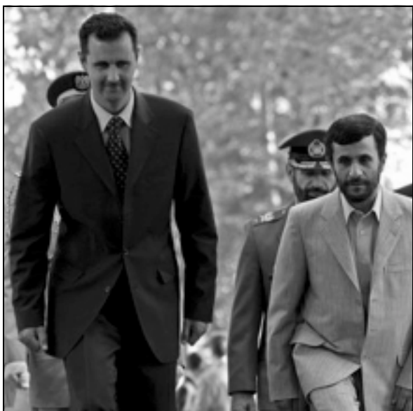
נשיא סוריה, בשאר אסאד, נפגש עם נשיא איראן, מחמוד אחמדינג'אד, טהרן, אוגוסט, 2005.

מכל אחד אחר היה אחראי להפיכת צבא היבשה הגרמני למבוסס על עוצבות טנקים עצמאיות – ובד-בבד עוקבים אחר הגידול בכוח השריון הגרמני ויכולותיו, היו עשויים לחזות ולהיערך לסגנון ולנתיבי התקפות הגרמנים (במקרה זה הכשל גדול במיוחד, שכן גודריאן התבסס על כתביהם המתקדמים של דה-גול, פולר, לידל-הארט ומרטל, כלומר, של צרפתים ואנגלים שזכו ליותר הערכה מקצועית בגרמניה מאשר במולדתם). עפ"י הכלל השני, על מנת להתמודד בהצלחה עם הפתעות, לא ניתן לוותר על אותה 'הבנה צבאית' של שדרת הפיקוד, התלויה בהכשרה אסטרטגית מקצועית.