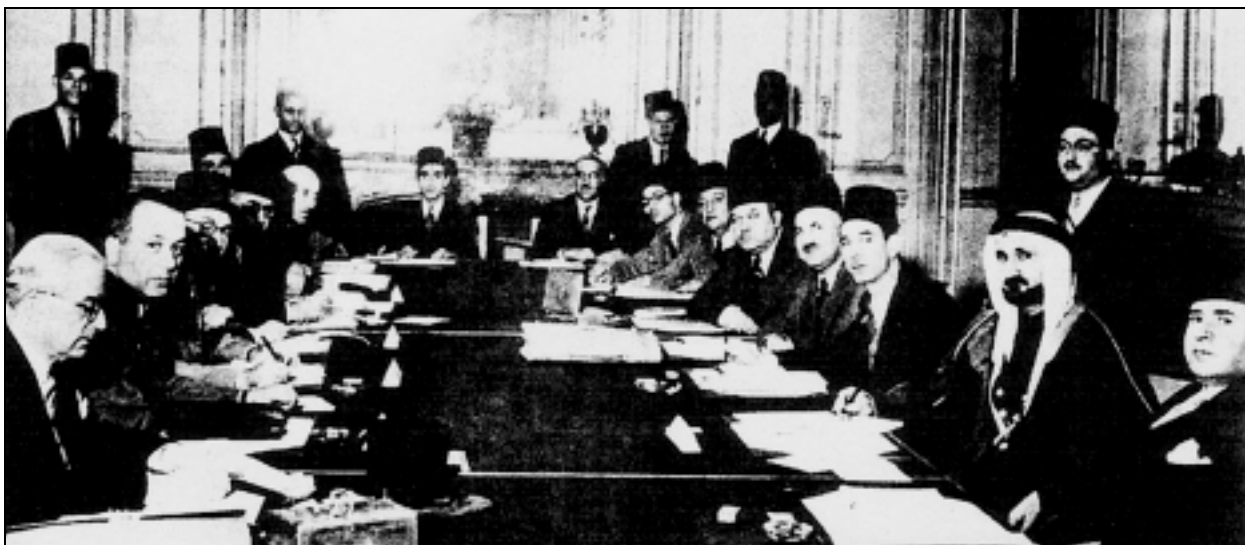
שיבת הליגה הערבית, דצמבר 1947, מקור Dan Kurzman, Genesis 1948

שאלת ארץ ישראל אינה נוגעת כלל למצרים. ממשלת לבנון סברה גם היא כי מוטב לקבל את החלטת החלוקה ככתבה וכלשונה כדי להימנע ממלחמה בארץ ישראל. 5