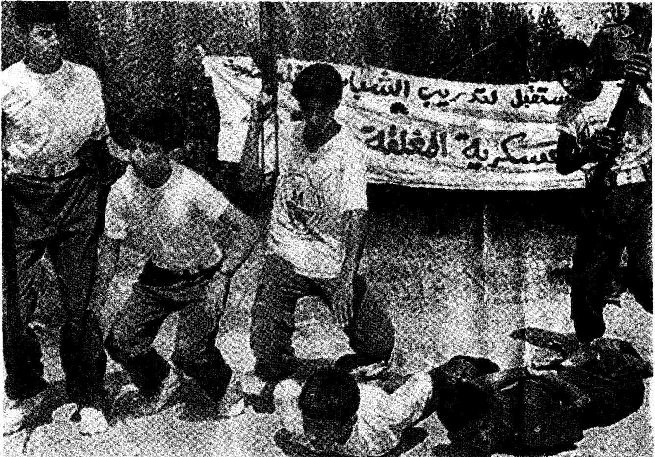
מחנה אימונים של נוער הפת"ח. הכנות לקראת כיבוש היישובים.

חיילים) אומנו לפתוח בהתקפות על שלושה יישובים באזור שכם". המקור: מפגש בין ראש השב"כ עמי אילון עם חברי ועד הביטחון של היישוב איתמר.