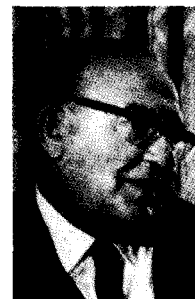
לוי אשכול. הססן שהחליט באומץ, אבל אחרי ניצחון גדול – מדיניות קטנה.

כולם חביבים, כולם נערצים, כולם כתובים לבלי-הימחק בלוח הקוממיות של ישראל – עד שפסעו אל סף מערכת ההנהגה המדינית האזרחית, עד שנחשפו ללא-רחם במו קומתם העצמית האמיתית, ללא פיגומי הפיקוד, ללא דוכני הדרגה הצבאית. 1