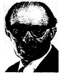
מנחם בגין. ראשון המגשימים של הנוסחה שטחים תמורת שלום.

הוועדה התגלה הקרע ביניהם, היריבות האישית הצורבת, כמעט בכל דיון. זכור לי במיוחד הדיון על פרויקט ה"אריה" (שהיה לימים לפרויקט ה"לביא", וסיים את חייו בין גרונטאות מוזיאון חיל-האוויר). שמעון פרס, הנכנס לאקסטוזה כל פעם שמדובר בפיתוח, תעשיות-על, חוץ-עתידי, ובעיקר בתעשייה האווירית בת-טיפוחו, תמך בהתלהבות בפרויקט, שפטרנו הראשי היה אז (ועד היום) ח"כ, יו"ר ועדת חוץ וביטחון, משה ארנס. "בנושא זה", הצהיר פרס חוזר ונשנה, "אינני באופוזיציה".