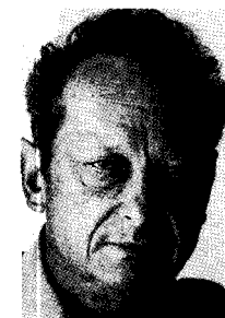
יגאל אלון. בן למשפחה יהודית מן הדור הישן... לא רק יליד הארץ, אלא גם יליד העם. היחיד מבין המצביאים ילידי הארץ בתנועתו שביקר בחריפות רבה את "קמפי-דייוויד".