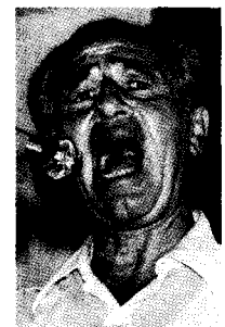
שמעון פרס. המלים "פיתוח", "הייטק", "השקעות", מביאות את האיש לאקסטוזה. פעם המטרה היתה מדינת ישראל, עכשיו היעד הוא מדינת טרור בלב ארץ-ישראל.

הבעיה הקשה ביותר בחיי הרוח והתרבות היא לדעת להבדיל בין גידול שפיר לבין גידול ממאיר. הנה אצלנו – פריחה בלתי נפסקת בכל תחומי הפעילות הרוחנית. מבחינה כמותית יש "שיפור ופיתוח" בכל תחומי חיינו: בחינוך