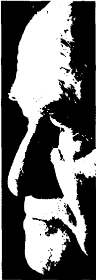
בן-גוריון. המנהיג שהוריש ליורשיו רק את חסרונותיו... "יחיד בדורו" – שפרש מחבריו ונותר יחיד...

לדבר על "הצנחה" או "הקפצה" או מינוי מלאכותי מלמעלה.