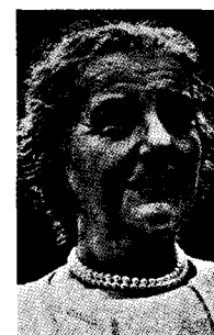
גולדה מאיר. האחרונה בשולת המנהיגות האותנטית של תנועת העבודה, הראשונה לביצוע נסיגה בפועל.

וכך ראיתי אותם, את כוכבי הצמרת של השלטון המפא"ייניקי, כשהם מסתובבים, זנבם בין רגליהם, במעגלי האופוזיציה של הכנסת התשיעית. ישבתי אתם בוועדת חוץ וביטחון, עם כל ה"לשעבריים"