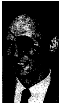
משה דיין. ...בדידות של חולשה ושל אכזבה. לאחר שני כישלונות טרגיים – כשר-ביטחון בממשלת גולדה-יום-הכיפורים, וכשר-חוץ בממשלת בגין-קמפ-דייוויד...

שלושה אישים היו בצמרת הפוליטית האזרחית של מדינת ישראל, שאינם כלולים בנושא זה. ישראל גלילי, משה כרמל ויגאל אלון הגיעו אמנם למעמדם המפלגתי והמדיני על בסיס הרקע הביטחוני-הצבאי של חייהם, ובעיקר במלחמת העצמאות, אבל שלושתם היו אנשי תנועה רעיונית במלוא מובן המילה. הם הגיעו לצמרת לאחר ובזכות צמיחה אותנטית בתנועתם, ולא פחות מכך בזכות חברות רבת-שנים והשפעה במסגרת קיבוצית. לגביהם אין