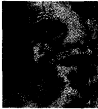
ירמיהו. "דרכי ציון אבלות מבלי באי מועד... היו צריה לראש, אויביה של..." (איכה א, 5,4).

ונטישת ערכים), וכאשר גברים בודדים אלה מגדילים את הביקוש בשוק המין המסחרי, מתפתח ללא הרף יבוא הזנות, והלגיטימציה חוגגת.