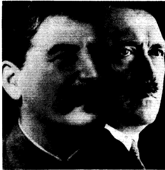
סטאלין והיטלר. לעומת משטרו של סטאלין, "יש לראות במשטר הנאצי כמעט אידיוליה ליברלית, שבה שרד משטר החוק". הבעיה עם קביעה תמוהה זו של ארנסט נולטה היא, שהוא צודק. גרמניה של חוקי נירנברג היתה מופת של מדינת חוק וסדר: החוק, הפרט והמדינה היו שהתמיס לפשע.

דואר אשר כבש אותה בסערה ברעיונותיו הניאנדרטליים, שהגיש בלשון ביבים זלה ועילגת.