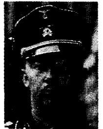
היינריך הימלר. מי שהביא את תורת המוסר הגרמנית למינציה בנאומו במי מפקדי מחנות הריכוז: "לאחר ש" סבלתם זאת, ונתתם ה" גונים... זה מה שמחשל אותנו. זהו דף התהילה ה" מזוהר הבלתי כתוב בקר רותינו... רוחנו, נשמתנו, אופיינו, לא ניזוקו..."

16 Helge Grabitz בספרה: NS-Prozesse (משפטי ה" נאצים, Heidelberg 1986).