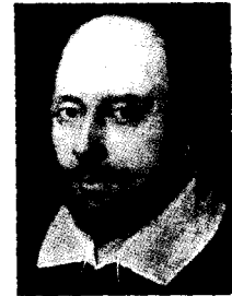
שייקספיר הוא OUT IN בעת ובעונה אחת. אמנם אותלו השחור הוא דמות אצילה וסרגית, קרבן תמים לתכני יאגו, הנבל הלבן, אלא שדודמונה הנאצלת היא שוב לבנה. (אילו ידעו אבירי התרבות האפרי-צנטרית עברית, היו נתלים בודאי בעובדה ש"לבן" הוא תמונת ראי של "נבל")

לפני הכיתה והציגה שקופיות של צילומי אפנה ושל פרסומת למוצרי קוסמטיקה, וחשפה, בנוסח הפסיכואנליזה מבית-מדרשו של ז'ק לקאן, את הסקסזים האלים הגלום בהם. היא בחרה במודעת פרסומת של חברת רבלון שבה נראית אשה שפניה מאופרים בכבדות, הניצבת עד לסנטרה בברכת מים. כשהופיעה השקופית, זעקה: "עריפת ראש!"