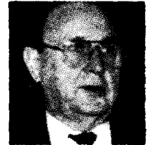
הנס דיריך גנשר: "על ארצות-הברית להשלים עם המציאות החדשה שהתחזתה באירופה"

11 המצרים חוזרים וקובעים שבכל מקרה של מלחמה בין ישראל לערבים מחיר יבואה של מצרים לאומה הערבית קודמת להסכמים שתחתה עם ישראל.