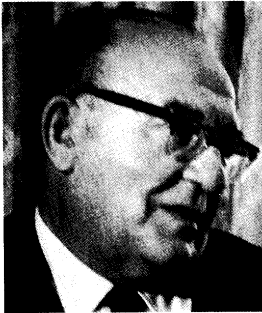
לוי אשכול: לא חשוב אם יש בצורת ישראל, חשוב שלא תהיה בצורת אמריקה (לשכת העיתונות הממשלתית)

25 הקונגרס, בפיו של ביר קן, הוא פרלמנט של זונות (Parliament of whores) שאינו מסוגל לעמוד על אינטרס לאומי מול שדולת אייפ"ק.