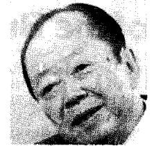
קיאצ'י מיאזאווה, ראש-ממשלת יפן: "...האמריקאים איבדו את מוסר העבודה שלהם והם שקועים בהנהלין פיגור כלכלי מתמשך"