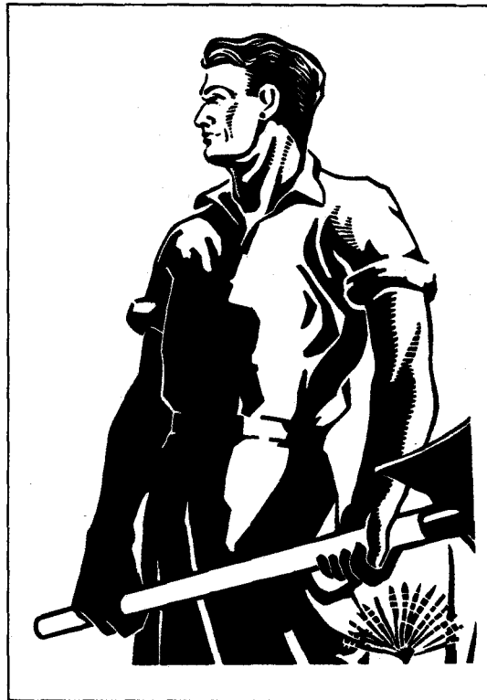
מועל עברי 1937. אכן המעמד הירואי, אולם נראה שמעמדים הירואיים עומדים ביחס הפוך לתמוקה. התוצר לעובד של צבאאי מועל זה הוא רק 60 אחוזים מן התוצר לעובד ברוב המדינות המתועשות.

על ישראל לצאת בהצהרה שהיא מוכנה להחזיר לאוצר האמריקני את הקרן בסך 400 מיליון דולרים מן "הסיוע הכלכלי" ובו בזמן לוותר על 400 מיליון הדולרים של מרכיב המענק ב"סיוע הצבאי". להצהרה כזאת – שהיא חסרת-תקדים ביחסי ושינגטון עם החייבים לה – יהיה ערך רב בדעת הציבור האמריקני בימים אלה של שפל כלכלי. בתמורה תבקש ישראל את שמיטת הריבית, ולבקשה זו סיכויים רבים להתקבל, שהרי בכל מקרה מדובר ברווח אמריקני של 400 מיליון דולרים נטו. למותר לציין את משמעות שמיטת הריבית על צמצום מצבת חובות החוץ של ישראל.