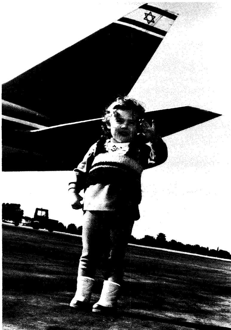
גלויה "ציונית" זו סומנת בחובה את תקותה של יש-ראל להגמוניה דמוגרפית ביהדות העולם, ואת הסיכוי למסה קריטית של שישה-שבעה מיליון יהודים ב-ארץ-ישראל, אשר תעקור (אולי) את רצונם של הערבים להכחינו.

שטרן רואה שכנות מכאן ומכאן: תהום של ניכור סביבתי כתוצאה ישירה של כישלון בקליטה ובשילוב העולים במערכות החיים במדינה. אך גם בתהליך מוצלח של קליטה ושילוב כלכלי, קיימת סכנה של היווצרות נטע זר והסתגרות בגטאות רוסיים בדלניים. פרופי מיכאל אגורסקי הזהיר, זמן קצר לפני מותו הפתאומי במהלך מסעו האחרון בברית-המועצות, מפני תסמונת ה"נטע זר" ותחילתה של "מלחמת-תרבות" בין עולים לישראלים. יורי שטרן קורא להתמודד בעוז בטרם פורענות. פרופי אגורסקי המנוח ראה שחורות בקוטב האור מתייצב ד"ר אורציון ברטנא: סופר, מבקר, מרצה בכיר לספרות עס-ישראל (באוניברסיטת בראילן) ואחד משני עורכי ביטאון אגודת הסופרים, מאזניים. ד"ר ברטנא רואה בעלייה רק אור תרבותי, המסלק צללים מחיי החברה והרוח בישראל, וצופה "מלחמת תרבות" מבורכת, היפוכה של זו המדאיגה את שטרן ושהילכה אימים על פרופי אגורסקי המנוח: